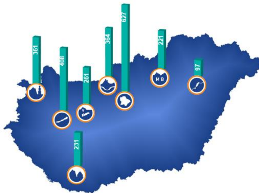
2. ábra. A gazdát cserélt lakóingatlanok és üdülők fajlagos átlagárai együtt 2019-ben Magyarország kiemelt üdülőkörzetiben