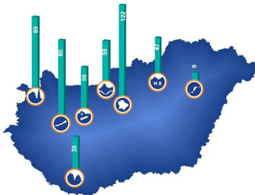
3. ábra. A gazdát cserélt lakóingatlanok és üdülők fajlagos átlagárainak változása együtt 2009 és 2019 között Magyarország kiemelt üdülőkörzeteiben (mozgóátlagokkal számolva) (Forrás: Takarék Index )

A TakaréK Index elemzőinek vizsgálata szerint az elmúlt tíz évben a budapesti üdülőövezetben emelkedtek a leginkább az ingatlanárak, tíz év alatt több mint megkétszereződtek. Majdnem a duplájára növekedtek Sopron-Kőszeghegyalja környékén, a Balatonnál pedig 80 százalékos növekedést mértek. Eközben a Tisza-tó környékén csak 9 százalékkal kellett többet fizetni a lakó- és üdülőingatlanokért tavaly, 2009-hez képest. Ez azt jelenti, hogy nyílik az áröllő a Balaton és a Tisza-tó között: míg 2009-ben átlagosan valamivel több, mint két és félszeres, addig tavaly már több mint négyszeres volt az átlagárak különbsége, a Balaton javára. (3. ábra)